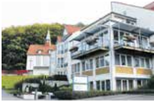
Betreutes Wohnen für Senioren